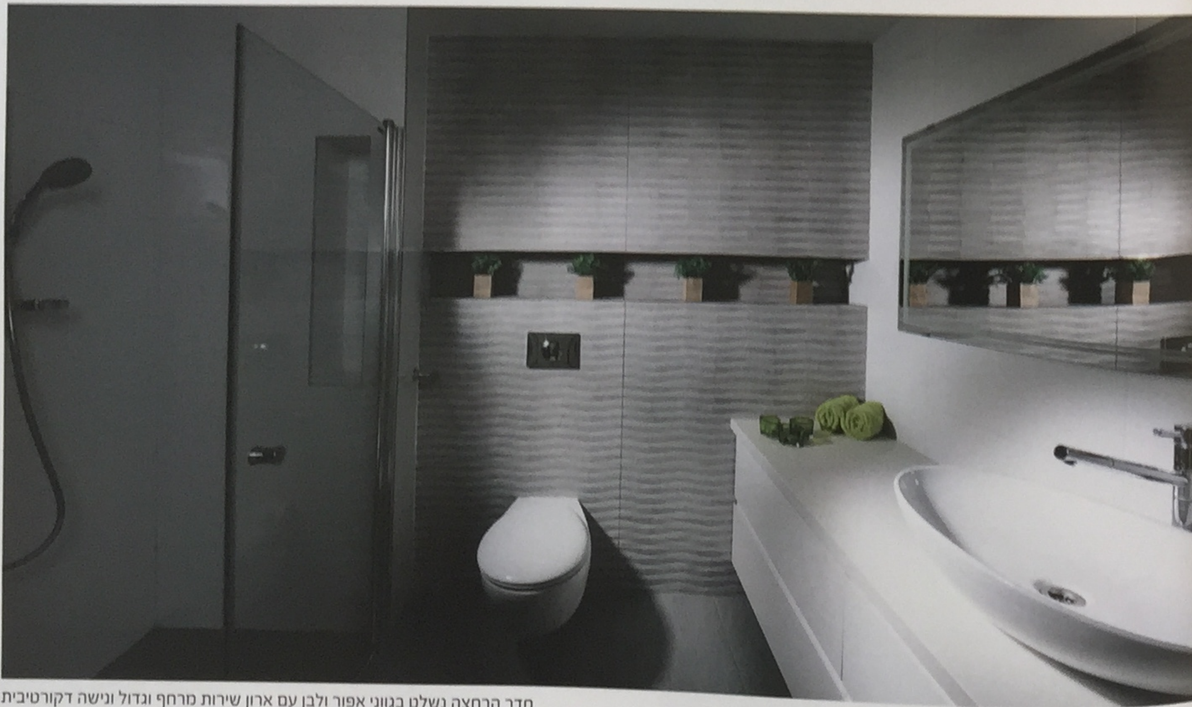
חדר הרחצה נשלט בגווי אפור ולבן עם ארון שירות מרחף וגדול ונישה דקורטיבית