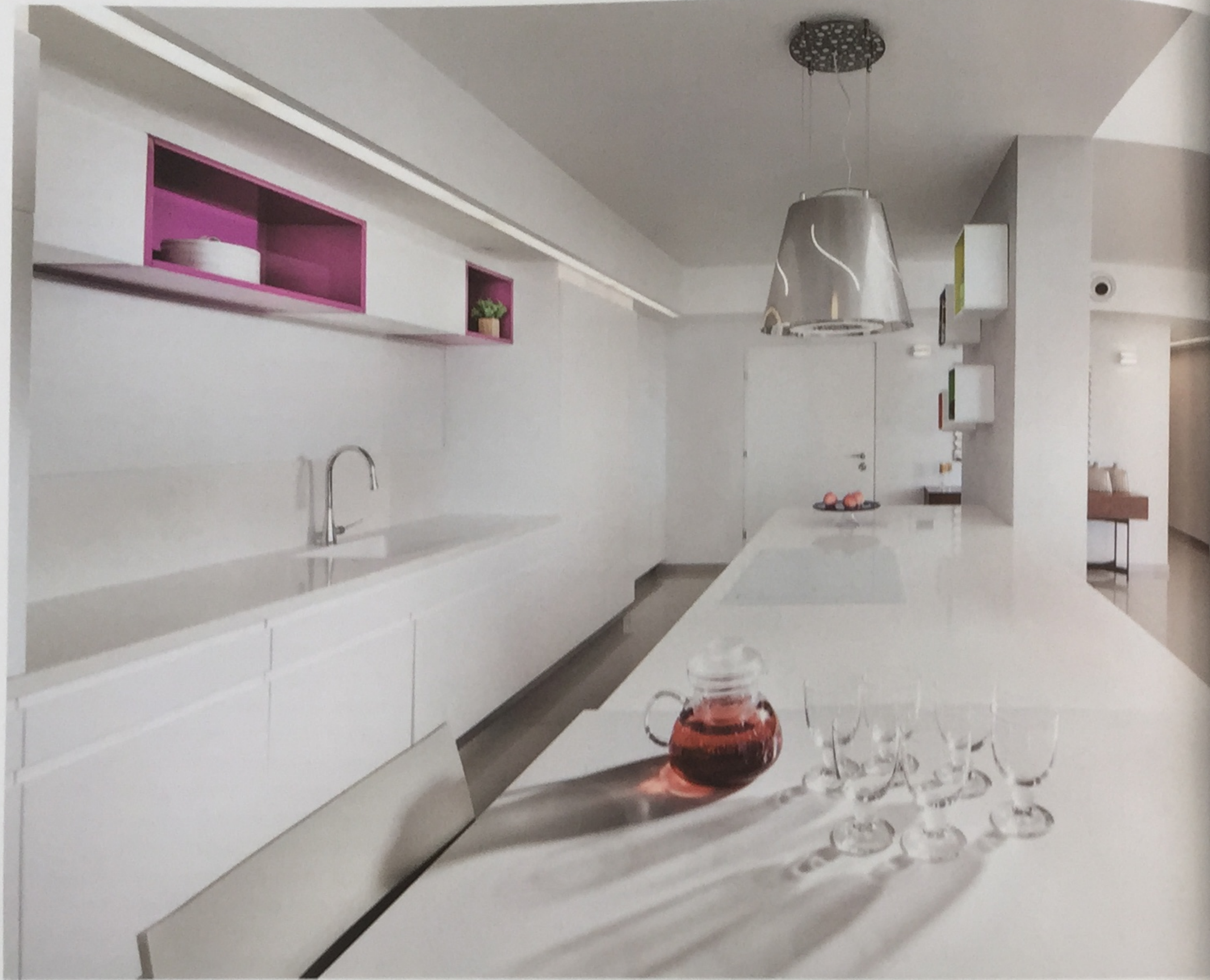
משטח עבודה רחב וארונות אחסון בשפע נטמעים היטב במראה הכללי של החלל הציבורי בזכות הנימוחים הנקיים והשפה העיצובית השקטה