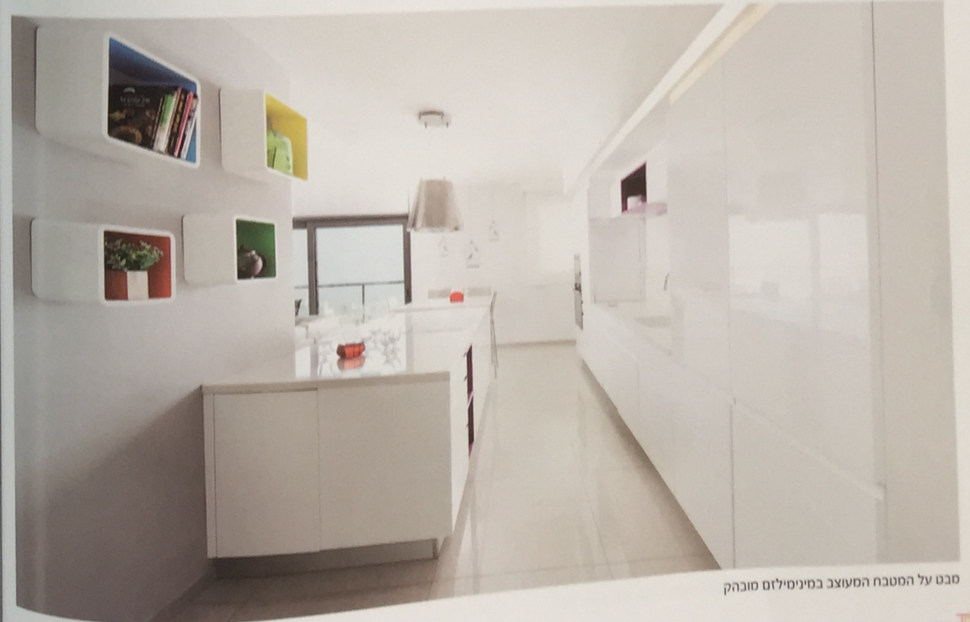
מבט על המטבח המעוצב במינימליזם מובהק