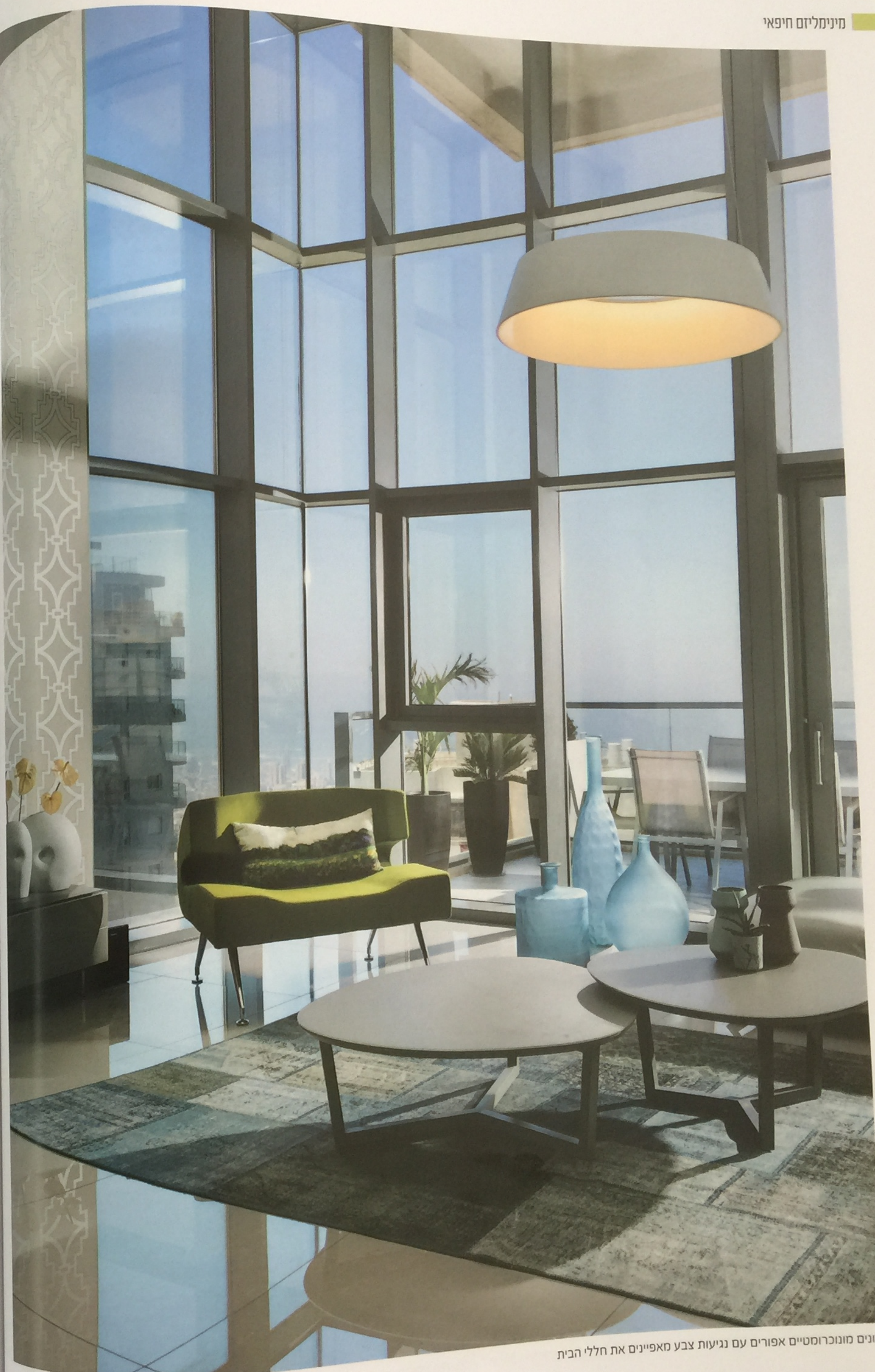
גוונים מונוכרומטיים אפורים עם נגיעות צבע מאפיינים את חללי הבית

"בקר הסמוך לפינת האוכל, נבנתה ספרייה לבנה בעלת אלמנט של קווים אלכסוניים, המקנים לה מראה פיסולי כמעט. זוהי דוגמא לפתרון שהינו פונקציונלי ואסתטי כאחד - חלל אחסון משמעותי לצד עיצוב בעל מראה מודרני"