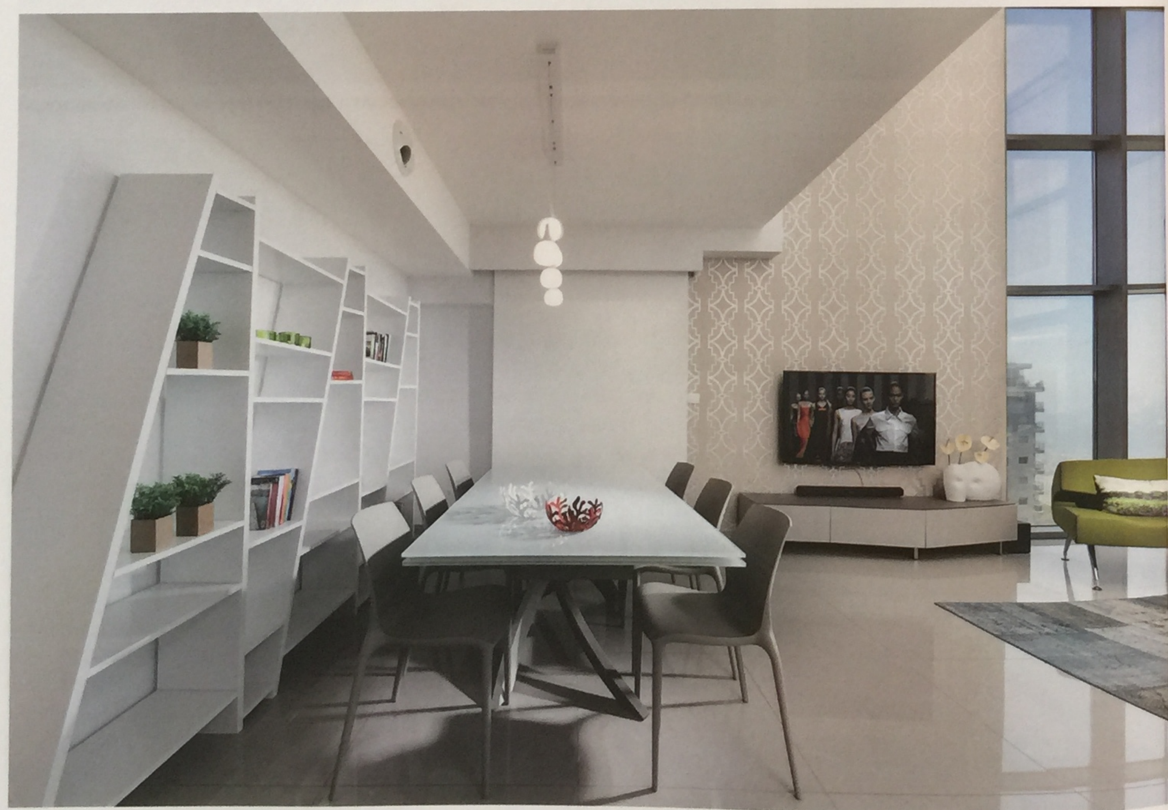
טפט עדין בעל דוגמא גיאומטרית, בגווני כסף ואפור מעניק לסלון עוד מבע יוקרתי