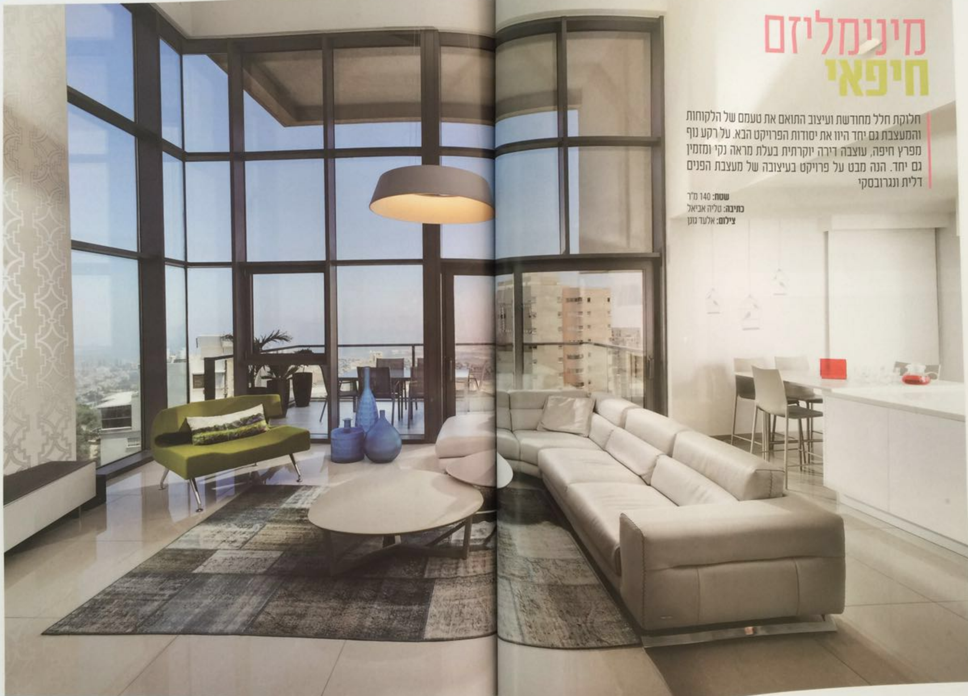
חלוקת חלל חדשה ועיצוב בסגנון מודרני מינימליסטי על רקע מפרץ חיפה - דירה בעיצוב דלית ונגרובסקי

שטח: 140 מ"ר כתיבה: טליה אביאל