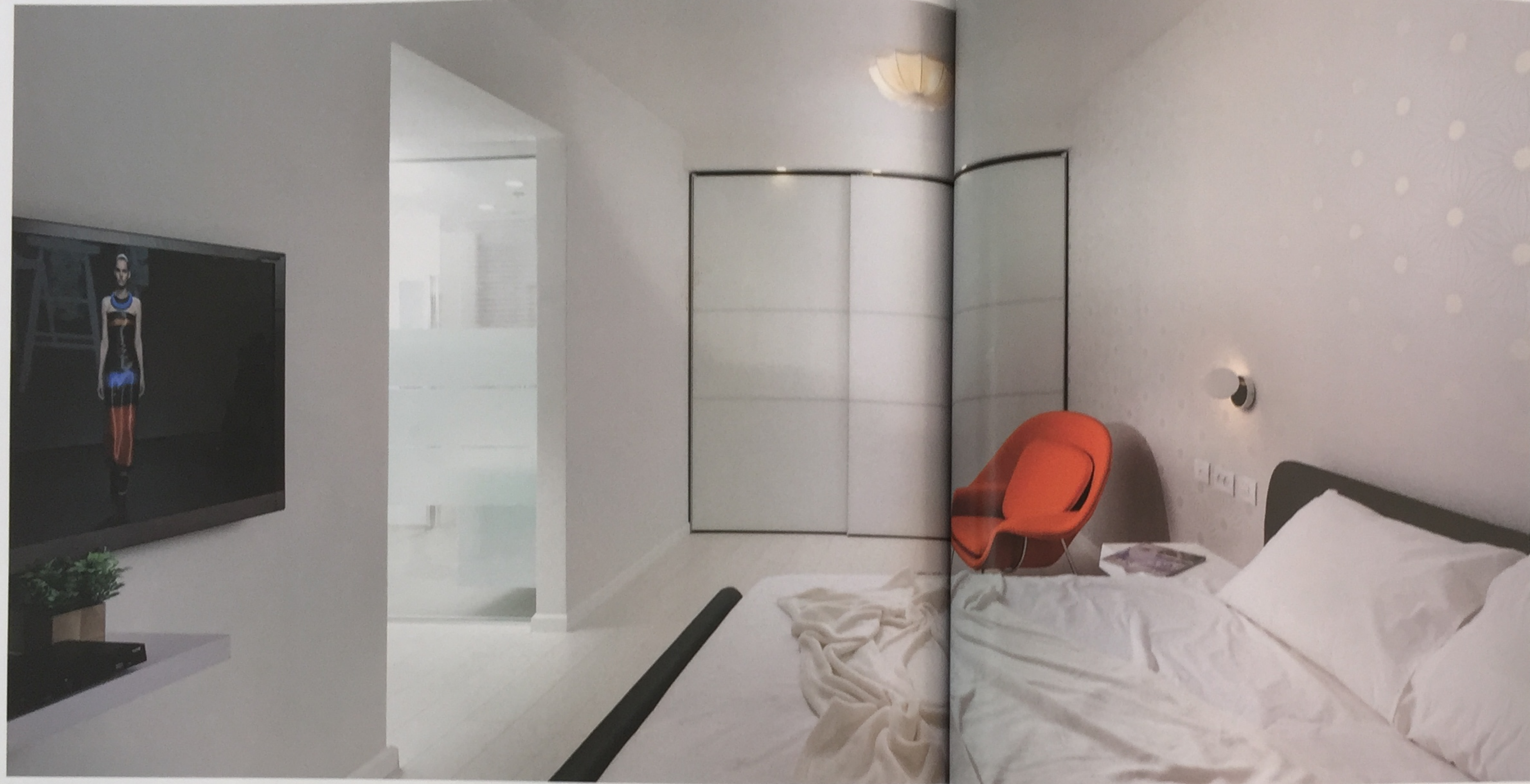
חדר השינה ממשיך את הקו העיצובי הכללי - עדין ומרווח עם הבזקי צבע עזים בריהוט שעושים את החלל