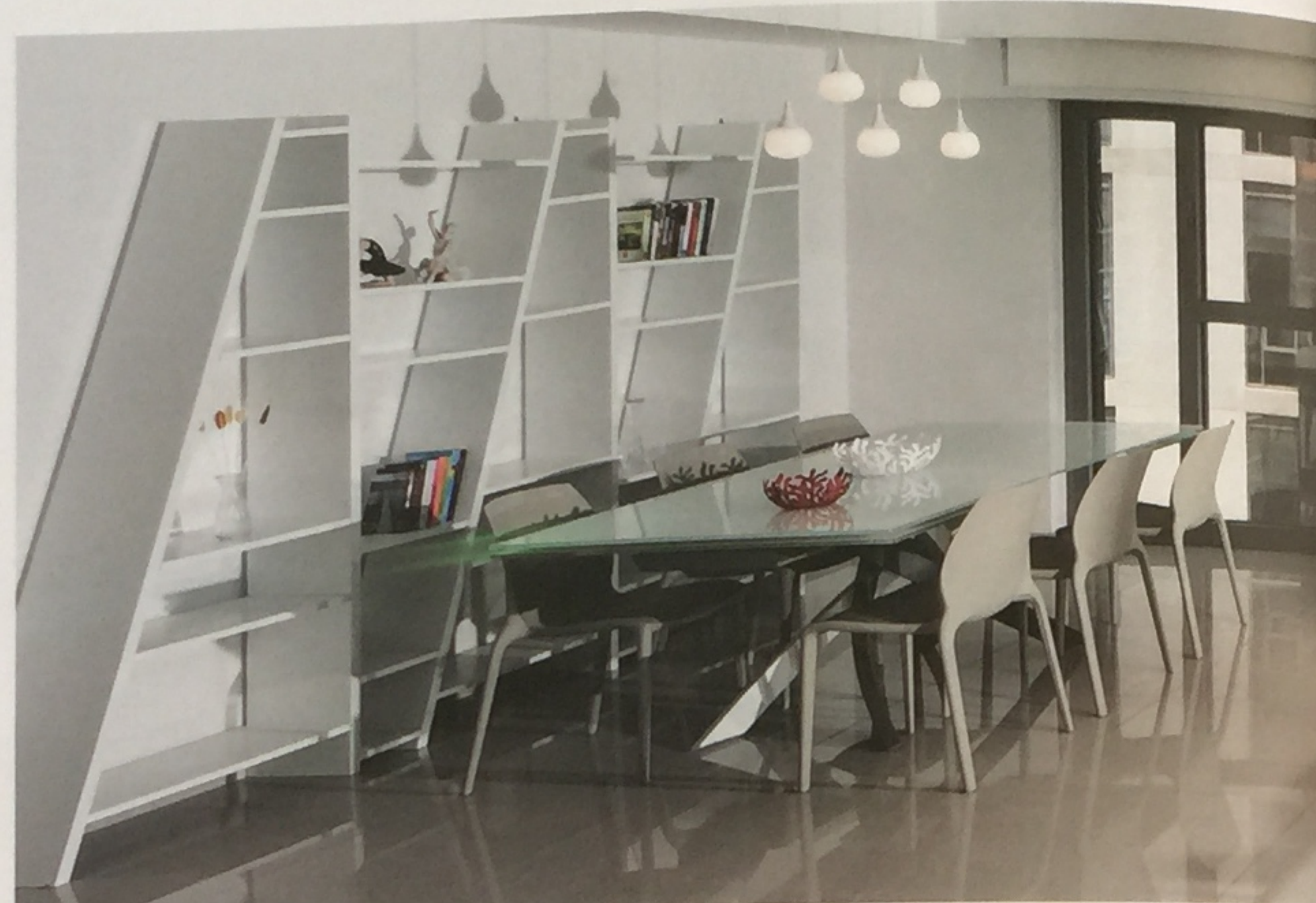
לצד פינת האוכל שובצה ספרייה לבנה בעיצוב ייחודי - תרומה אסתטית ופונקציונלית גם יחד