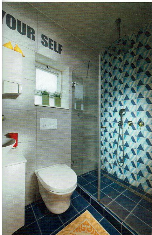
חדר רחצה הורים: ריצוף ואביזרים סניטריים: "רצף".