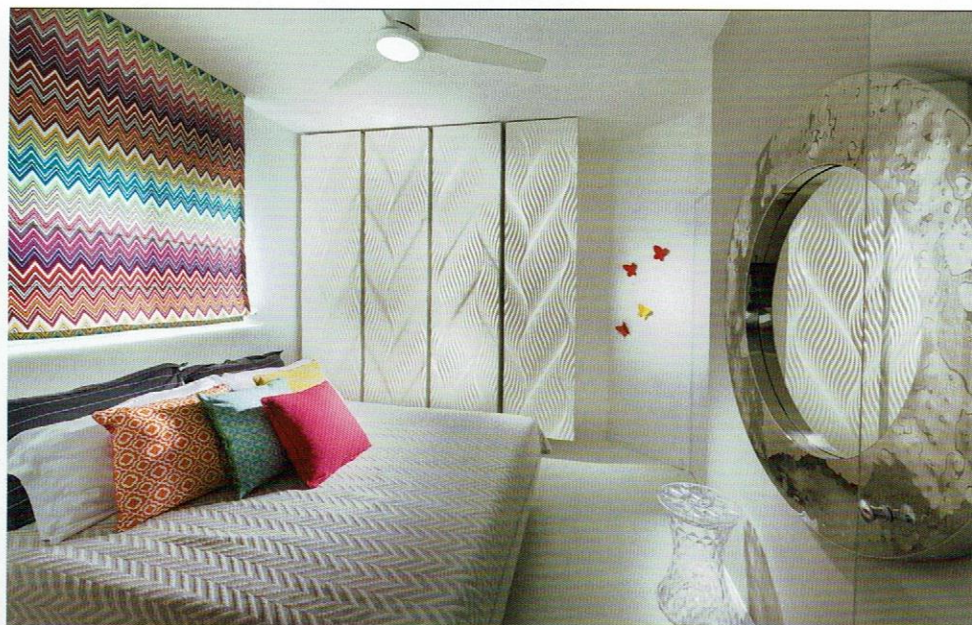
יחידת ההורים: קיר ההפרדה עם חדר הרחצה הצמוד הוסר והוחלף במחיצת זכוכית, ריצוף פרקט, פריטי נוי ונגיעות צבע כמובן. ריצוף פרקט: "טופולסקי".